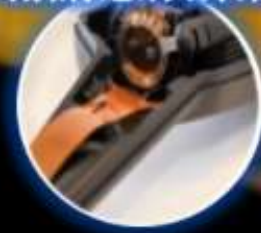
車載訊息娛樂設備