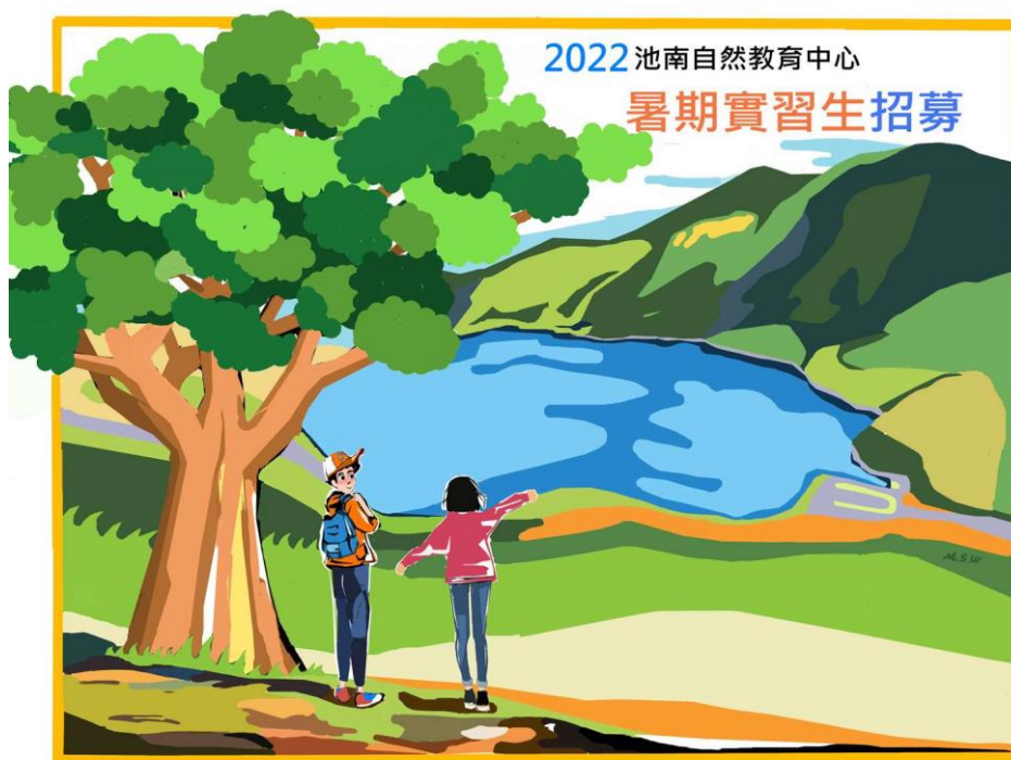
走入洄瀾時光森林，體驗低海拔山水之美，實踐友善環境生活

花蓮林區管理處為促進池南自然教育中心與大專院校學術機構合作，開創青年學子一個嶄新的學習環境，藉由理論與實務結合之培訓課程，提供學生參與環境教育及志願服務管道，以培育未來環境教育專業從業人員為目標，特訂定本計畫